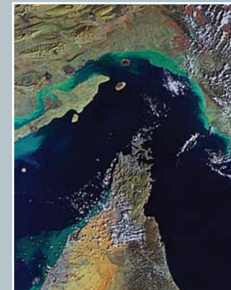
Fig. 2 - Ingrandimento della parte centrale della Figura 1.