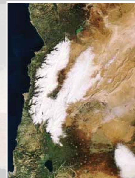
Fig. 4 - Ingrandimento di una parte della Figura 3.