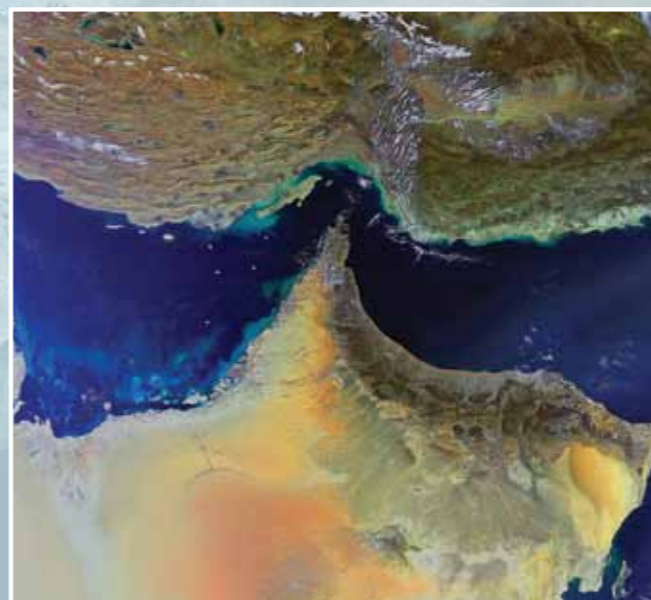
Fig. 1 - Immagine multispettrale dello Stretto di Ormuz, rilevata dallo strumento MERIS di Envisat il 4 febbraio 2011 e visualizzata in colori naturali (RGB 7,5,3+2).