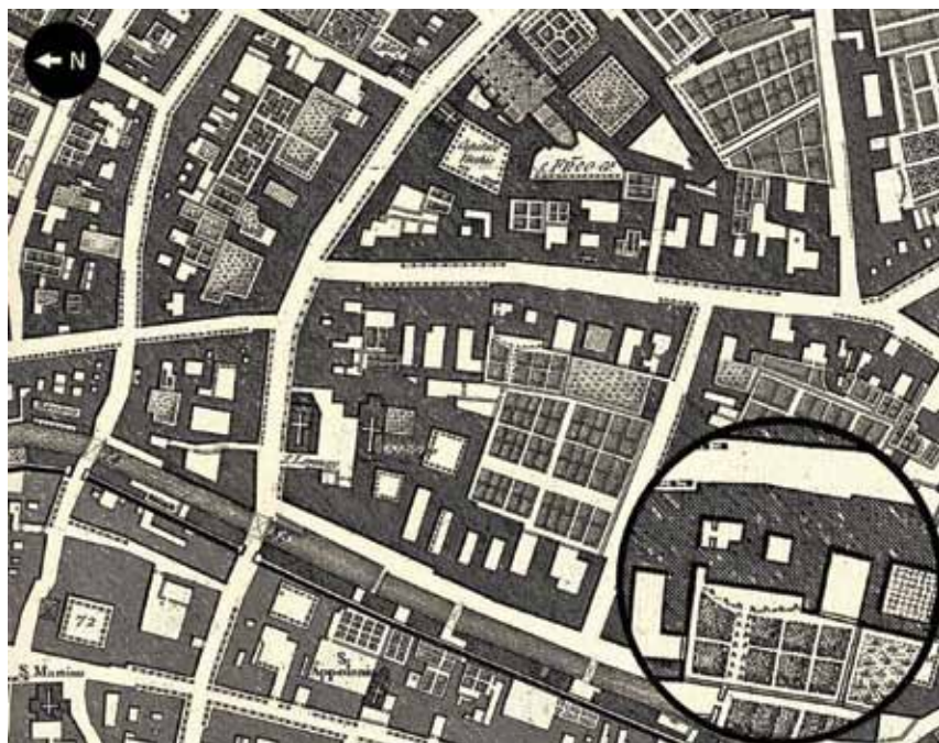
Fig. 2. Dettaglio di Palazzo Wollemborg (allora Capodilista) nella Pianta di Padova di Giovanni Valle (1784).

La ricerca di una nuova, degna e unica sede per i due Istituti poté giovare dell'accordo tra gli eredi Wollemborg e l'Università di Padova per la vendita a lotti successivi dei tre Palazzi (Ca' Dottori, Palazzo Wollemborg e Ca' Salgari o Borin)