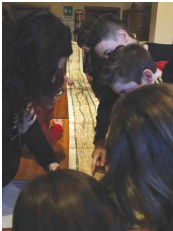
Fig. 4. Studenti delle scuole secondarie di primo grado osservano una riproduzione storica della tavola peutingeria all'interno di un'attività di lettura cartografica partecipata proposta nel laboratorio n.18 del Museo di Geografia dal titolo: "Giro del mondo in 80 carte".

prie esigenze particolari. Il pubblico a cui si rivolge include in primo luogo chi ha quotidianamente a che fare con tematiche geografiche per esigenze di formazione o professionali (docenti e studenti universitari, insegnanti e alunni delle scuole di ogni ordine e grado, professionisti nei settori paesaggistico, ambientale, urbanistico...), ma anche gli appassionati della geografia e il pubblico che a diverso titolo (turisti, associazioni, famiglie, cittadini...) vede nel Museo un'occasione per arricchire il proprio bagaglio conoscitivo sul mondo e acquisire maggiore consapevolezza della propria responsabilità ambientale e sociale.