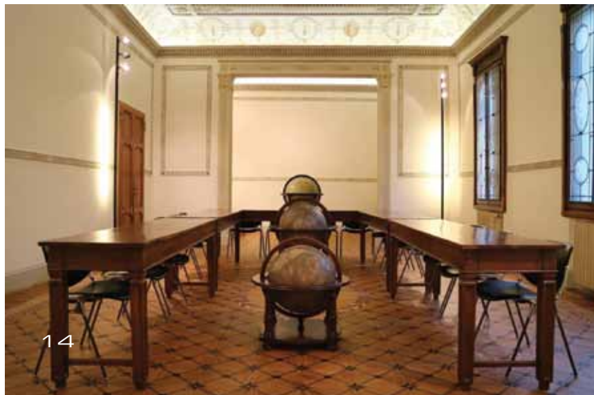
Fig. 1. Sala della musica, Palazzo Wollemborg.