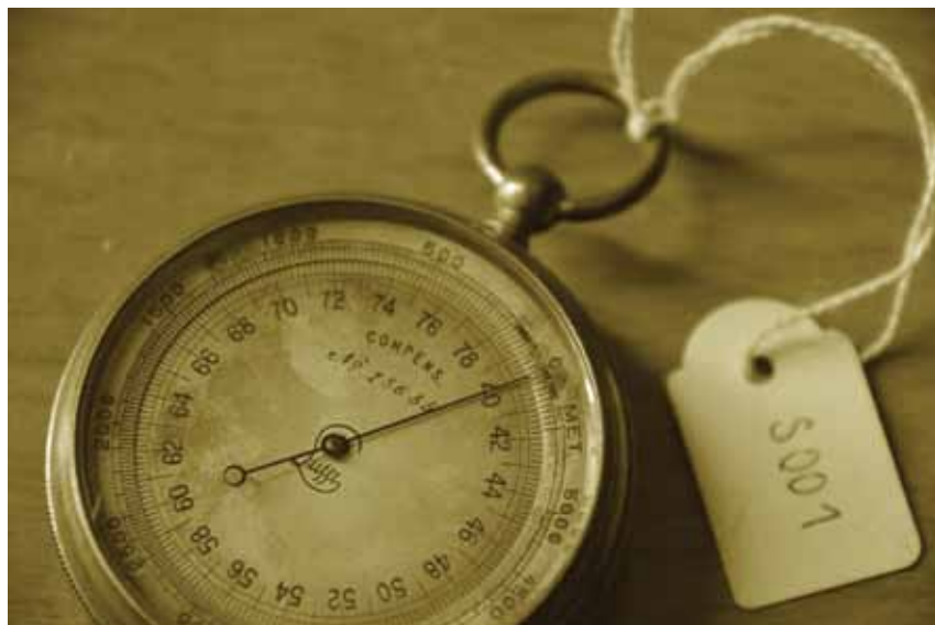
Fig. 3. Altimetro barometrico in ottone e vetro (anni 20 del '900). Prodotto da: Lufft, Fellbach (Stuttgart). Questo è il primo strumento inventariato dal Museo di Geografia.

La progettazione scientifica del Museo ha portato allo sviluppo di un percorso narrativo che ruota attorno a tre ambiti della ricerca geografica e al contempo a tre modi di conferire significato al "teatro del mondo". I tre modi sono sintetizzati da altrettante parole chiave, che danno vita al brand del Museo di Geografia: Esplora, Misura, Racconta . Gli oggetti del patrimonio e della tradizione di ricerca patavina sono così inseriti in una cornice di senso più ampia, per condurre il visitatore a comprendere l'utilità e l'attualità di una disciplina fondamentale per la sua capacità di interrogare la complessità del mondo. Il progetto di allestimento, sviluppato in collaborazione con lo Studio AMUSE, non ricorre soltanto al linguaggio visivo, ma permette ai visitatori di entrare in relazione con gli oggetti utilizzando molteplici canali sensoriali sfruttando così le potenzialità dello storytelling immersivo). In linea con le più recenti riflessioni a livello internazionale sull' edutainment , l'allestimento valorizza sia la dimensione didattica (di approfondimento su oggetti e temi) sia quella dell' engagement (con giochi e soluzioni capaci di stimolare il visitatore ed imprimere il ricordo dei contenu-