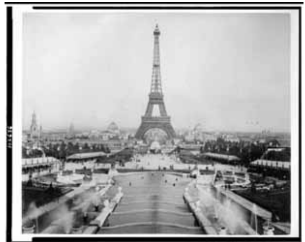
Fig. 4. La Torre, opera dell'ingegnere Gustave Eiffel, fu costruita in poco più di due anni per l'inaugurazione dell'Esposizione universale del 1889. Oggi è uno dei monumenti più visitati, sebbene il progetto iniziale prevedesse un suo smantellamento una volta conclusa l'Expo. (Foto: <www.loc.gov>).

no svolti con maggiore continuità storica nei tempi moderni sono i Giochi olimpici estivi e le Esposizioni universali, casi particolarmente interessanti non solo per le caratteristiche intrinseche, ma anche per le potenzialità in termini di effetti successivi alla loro conclusione (Clark, 2008; Hall, 1989; Linden e Creighton, 2008; Mazzeo, 2008; Roche, 2000).