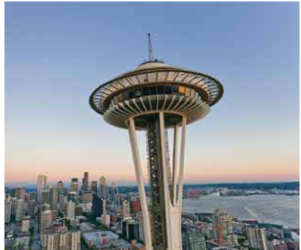
Fig. 2. Lo Space Needle (Ago Spaziale), costruito a Seattle per l'Expo 1962, è il principale simbolo della città; la torre, alta circa 184 metri, quando fu completata era la struttura più alta della costa pacifica statunitense. (Foto: <www.spaceneedle.com>).