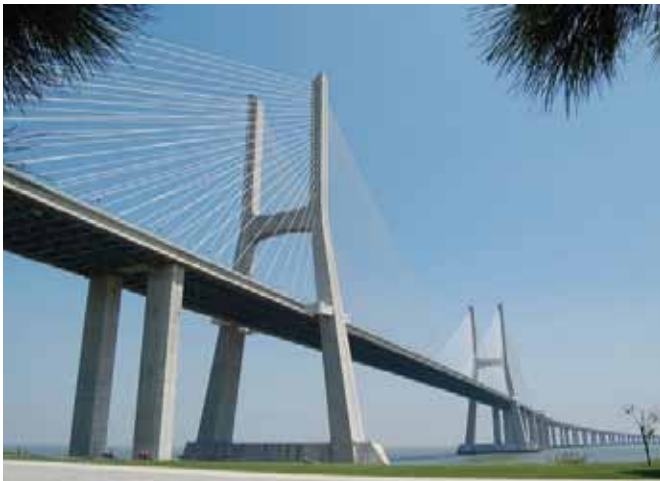
Fig. 3. Il ponte dedicato a Vasco da Gama è stato realizzato, su progetto di Santiago Calatrava, per l'Expo di Lisbona del 1998 e "oltre al suo ruolo fondamentale nel sistema di trasporti urbano, ha avuto anche un valore altamente simbolico per la città, rappresentando la concretizzazione delle attese da parte della popolazione residente" (La Rocca, 2008, p. 39).