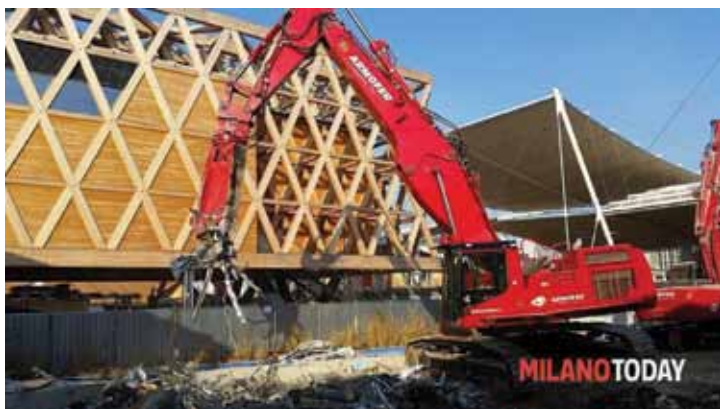
Fig. 8. Dopo la chiusura di Expo Milano (31 ottobre 2015) sono iniziate le operazioni di smantellamento del sito, attualmente ancora in fase di svolgimento. Nella foto si riconosce il padiglione dell'Austria.

Quando il territorio si riappropria con varie modalità dell'eredità dell'evento globale e riesce a trasformarla in patrimonio e in capita-