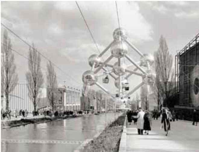
Fig. 1. L'Atomium, dalla forma di una gigantesca molecola di ferro, è opera dell'ingegnere André Waterkeyn e degli architetti André e Jean Polak. Rappresenta il simbolo del sito di Expo 1958, localizzato a nord-ovest della città di Bruxelles sull'altopiano di Heysel, che mantiene ancora oggi la sua vocazione espositiva, con un centro congressi e fieristico (Guala, 2008).