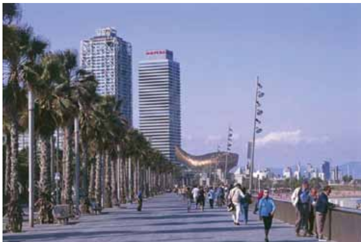
Fig. 7. La passeggiata della Barceloneta. La città catalana ha colto l'occasione dei Giochi olimpici per proseguire la trasformazione urbana avviata negli anni ottanta (si vedano in particolare i "100 progetti" di Oriol Bohigas) e per ammodernare anche le strutture sportive, senza tralasciare interventi sul fronte mare e "distribuendo" opere e infrastrutture su molti quartieri, dalle aree centrali a quelle periferiche. (Foto: < www.sapere.it/sapere/mediagallery/architettura-a-barcellona.html >).

vernali di Torino 2006, i cui impianti erano distribuiti tra la montagna e la città.