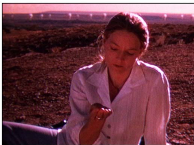
Da una scena del film "Contact"

Quando il monitor diventa un oblo. Informazione geografica e turismo virtuale nel Web