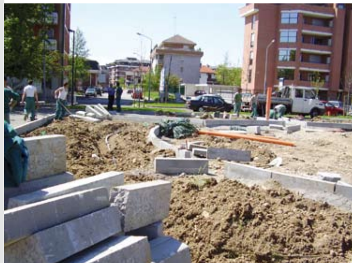
Fig. 5. Novara, l'inizio dei lavori per la costruzione del "giardino del mondo", secondo il progetto degli alunni della scuola Carlo Levi.