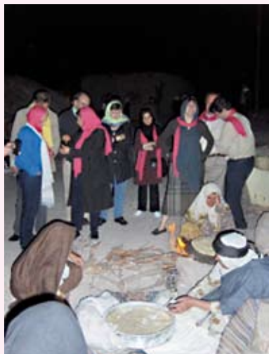
Un momento dell'escursione nel villaggio troglodita di Maymand (a sud di Yazd): la preparazione del pane alla maniera tradizionale.