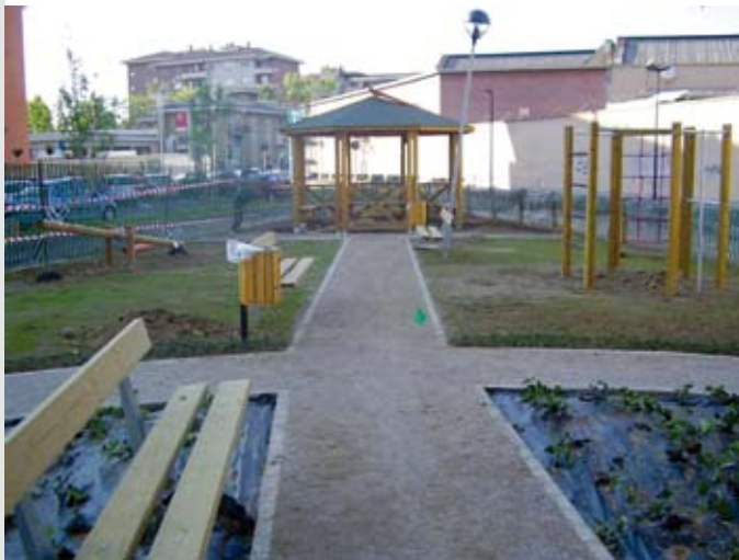
Figg. 6 e 7.

Maggio 2009: il "Giardino del Mondo" è terminato. Chi dice che i sogni non possono diventare realtà si sbaglia: abbiamo lavorato, ci abbiamo creduto ed il nostro impegno è stato premiato.