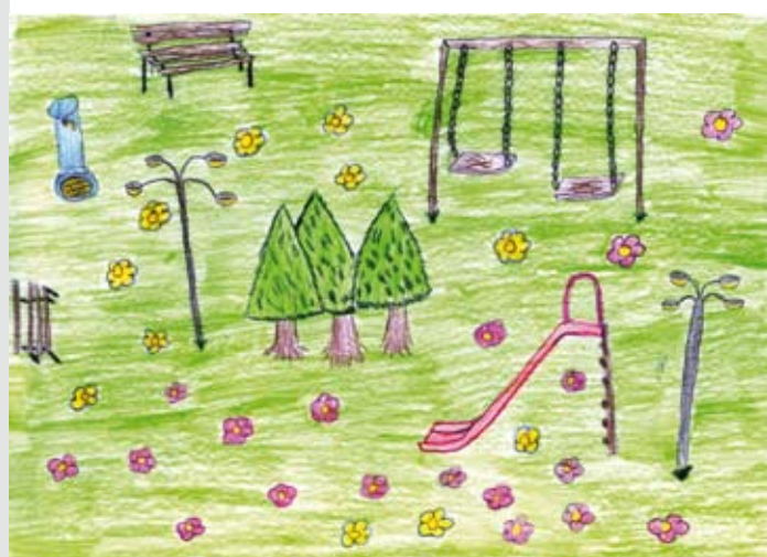
Fig. 3. Alcune proposte progettuali degli alunni della scuola Carlo Levi di Novara.

l'Offerta Formativa (POF) dei plessi del IV circolo didattico di Novara.