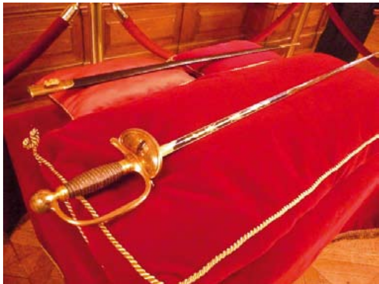
Fig. 4. La preziosa spada consegnata a Jean-Robert Pitte per l'investitura ad Accademico di Francia.

sità, di senso del dovere tanto quanto del diritto, della cura del merito tanto quanto della nascita. È questa la vera Repubblica per la quale vale la pena di combattere.