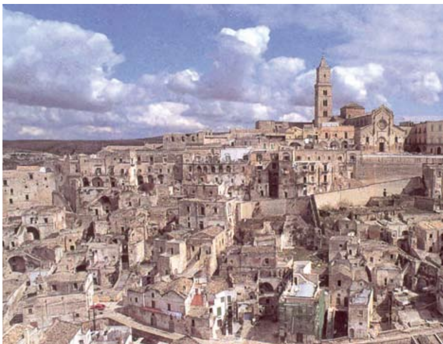
Fig. 1. I Sassi di Matera.

Perché questa attenzione per la questione del tempo e del paesaggio? In senso generale è la provvisorietà del nostro vivere che ci preoccupa e, davanti al mutamento costante, ci sentiamo in dovere di fissare qualche punto fermo. Kevin Lynch in un libro dal titolo Il tempo dello spazio aveva ben evidenziato questo genere di preoccupazioni. Lynch apriva il suo saggio con una riflessione sul mutamento. Egli riteneva che "la qualità dell'immagine personale del tempo è fondamentale per il benessere individuale e per il controllo del mutamento ambientale e un nostro successo nell'acquisire senso di stabilità" (Lynch, 1972, p. 11). Da parte sua, David Lowenthal evidenzia il tema della durata: "la vita non è solo una successione di avvenimenti separati, essa implica la qualità della durata, del passaggio del tempo. Strattonati dal cambiamento ci attacchiamo alle tracce del nostro passato per essere