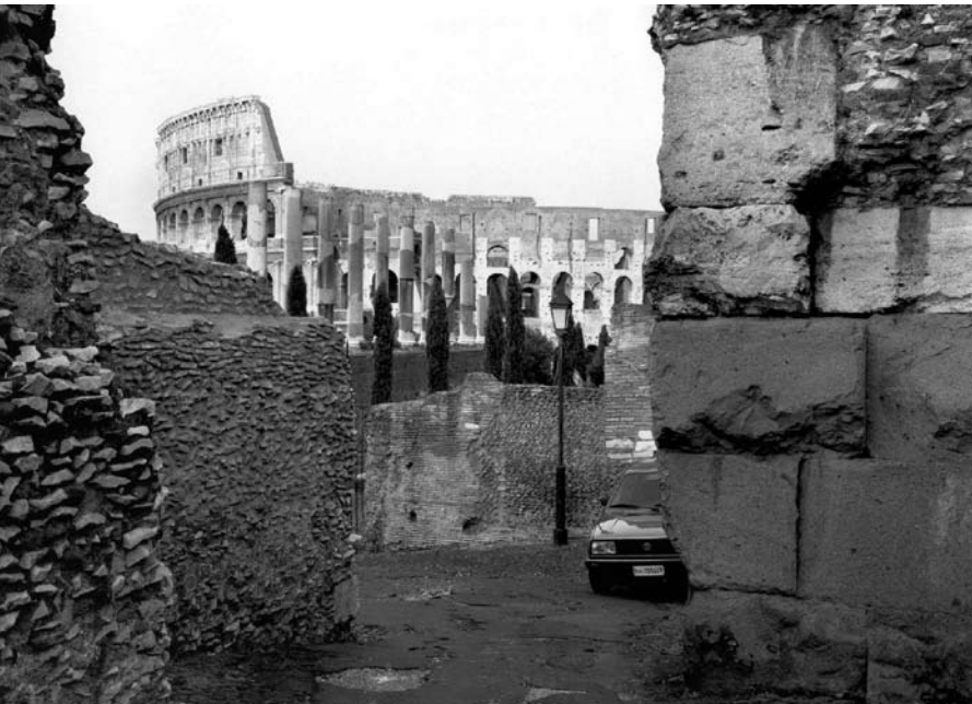
Fig. 2. Roma 1989.

sicuri di ciò che noi siamo” (Lowenthal, 2008, p. 163). Eugenio Turri sottolinea poi come il rispetto per il passato è un dato insopprimibile dell’etica di ogni società e che i paesaggi costituiscono parti vive della scenografia paesistica per il tempo dell’esistenza individuale e per le generazioni che verranno (Turri, 1998, p. 139). Adottando questa prospettiva il paesaggio può essere allora visto come un immenso deposito di memorie.